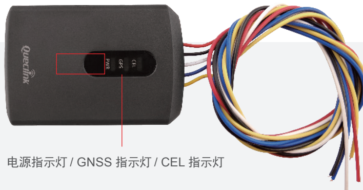
电源指示灯 / GNSS 指示灯 / CEL 指示灯